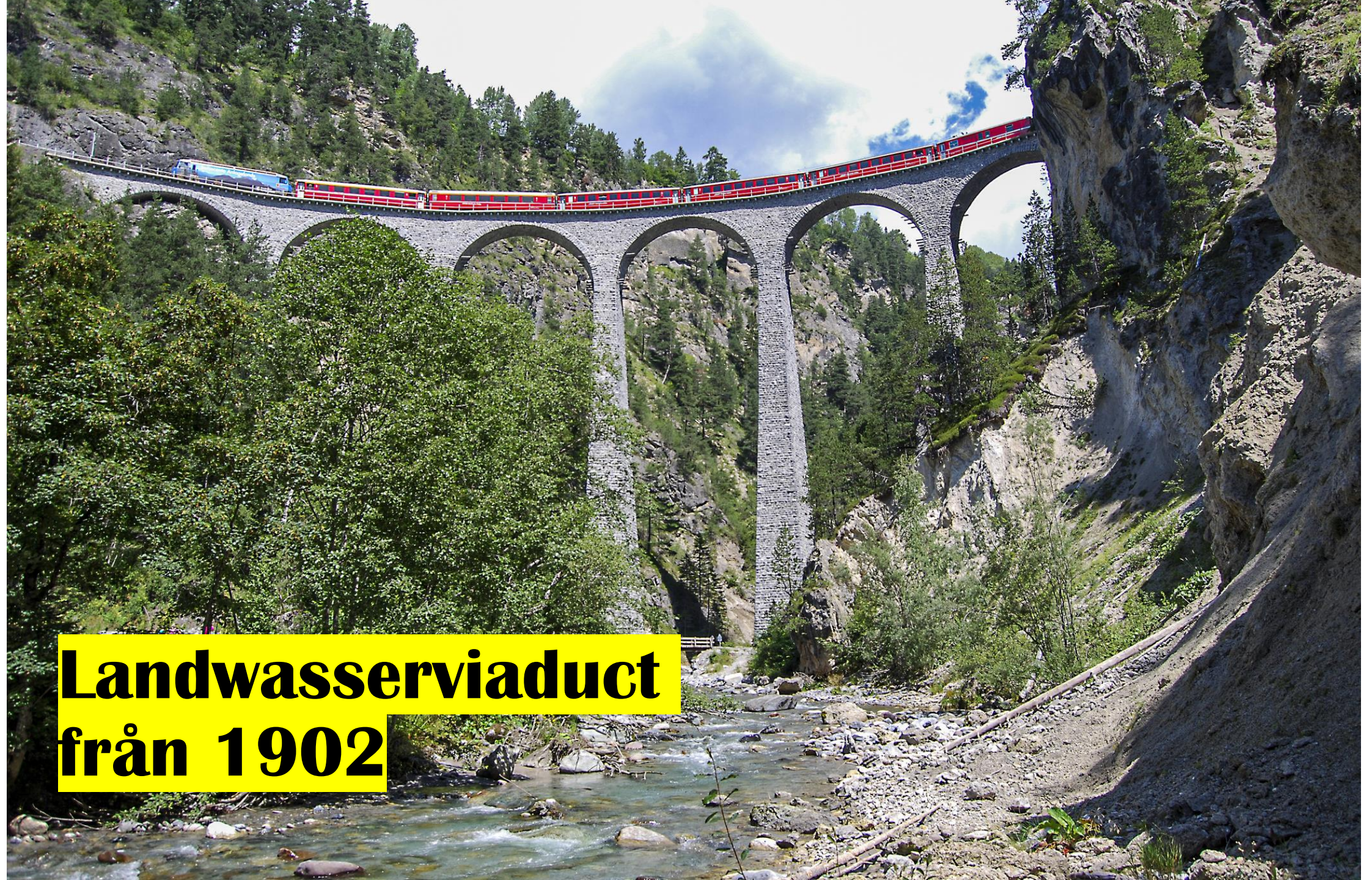
Landwasserviadukt från 1902